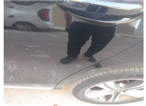
Porte arrière gauche (Rayure)