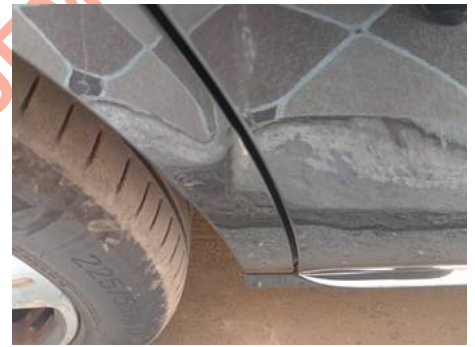
Aile arrière droite (Impact)